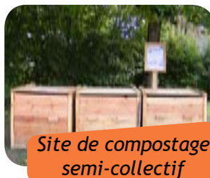
Site de compostage semi-collectif

Nous serons financés de nouveau sur les sites de compostage semi-collectifs, mais cette fois-ci, sur des projets de sites de compostage en milieu scolaire et notamment dans les collèges de tout le département.