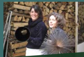
Préparation de l'hiver, activité ramonage

NOUS RECHERCHONS TOUJOURS QUELQUES ÂMES CHARITABLES POUR NOUS DONNER UN PEU DE TEMPS BÉNÉVOLE AU SEIN DE L'ASSOCIATION !