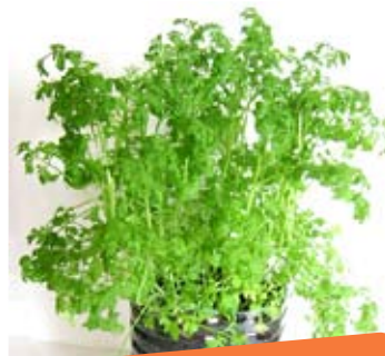
Pousses de cresson

Si à l'inverse aucune graine ne pousse, cela signifie que votre compost est demi-mûr et qu'il est encore phytotoxique (il n'est pas assez décomposé et peut tuer vos plantes si vous l'utilisez tel quel). Laissez encore votre compost mûrir quelques mois puis renouvelez le test.