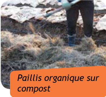
Paillis organique sur compost

Épandez votre compost en surface sur les parcelles à nu. Pour une efficacité optimale, couvrir ce compost avec un paillis organique (paille, gazon séché, broyat de bois).