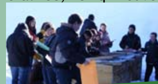
Animation scolaire en collège

Pour cette première année de financement par le conseil général 38, cinq nouveaux