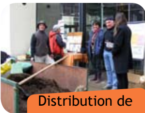
Distribution de compost