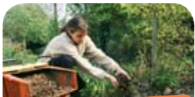
Technique du paillage

Le mulching ou paillage est une technique de fertilisation naturelle, c'est un moyen de nourrir son sol sans engrais, limiter les arrosages, prévenir le développement des mauvaises herbes et éviter le désherbage, agir en régulateur thermique, protéger de l'érosion et de la formation de croûte en surface, constituer une niche écologique pour la faune du sol.