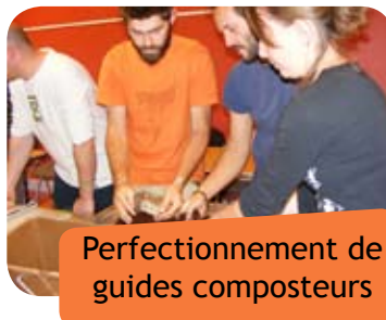
Perfectionnement de guides composteurs