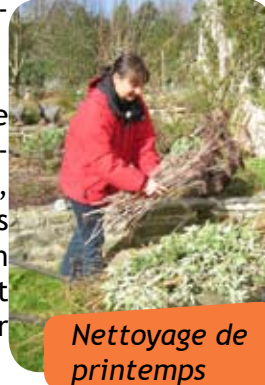
Nettoyage de printemps

Le printemps est donc l'occasion de stocker cette matière carbonée en vue du compostage en grande quantité de mi-printemps (à partir d'avril-mai), quand on doit gérer beaucoup de tontes de gazons et de jeunes pousses de mauvaises herbes, riches en azote. Le broyage des tailles et branchages permet de diviser le volume de stockage par 10 et d'apprêter le matériau pour le compostage.